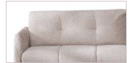
Rücken mit Punktheftung