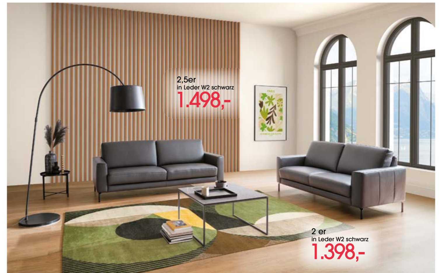
2,5er in Leder W2 schwarz 1.498,-

Sofagarnitur BROADWAY Armlehne A; in Leder W2 schwarz; Metallfuß schwarz