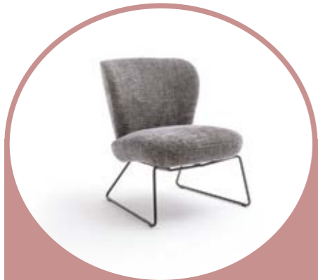
Retro-Sessel BENNI in Stoff; ca. 60 cm 529,-